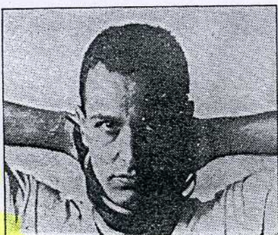
חנוכיות שצבא-אפשר להדליק, לחובר

לשאלה, מה מושך מעצבים צעירים וחילונים לעצב יודאיקה דווקא, יש מספר תשובות אפשריות. קסמי יודאיקה היא שם פיתוי קל למי שמקצועו צורפות והוא נהנה במחוסם הכלכלי של השוק הישראלי. אבל מסתבר שהאתגר הוא