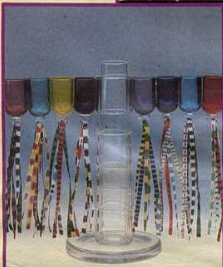
▲ ליא ליאנוני, ניו יורק, מנורת חנוכה וזכוכית, סינר במורנו, איטליה.