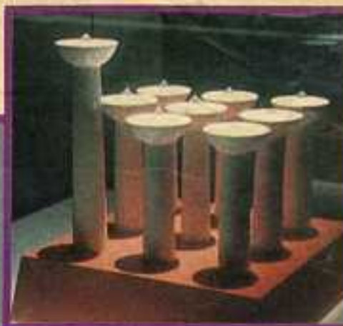
▲ תיא קרוסבי, אנגליה, מנורת חנוכה.

ימים אלה מציג מוזיאון שאל של מנורות יוצאות זפן בתערוכה מיוחדת מנורות מצווה". מעצבים אדריכלים בעלי שם בארץ וברחבי העולם נרתמו בקשת המוזיאון עצבו מחדש מנורות מצווה. חלק מהמעצבים מחו"ל אינם יהודים והם קיבלו מידע מפורט של מפקיד האור יהדות ועל מהותן של מנורות החנוכה.