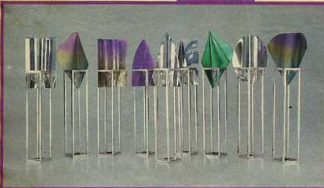
▲ אריה אופיר, ירושלים, חנוכה.