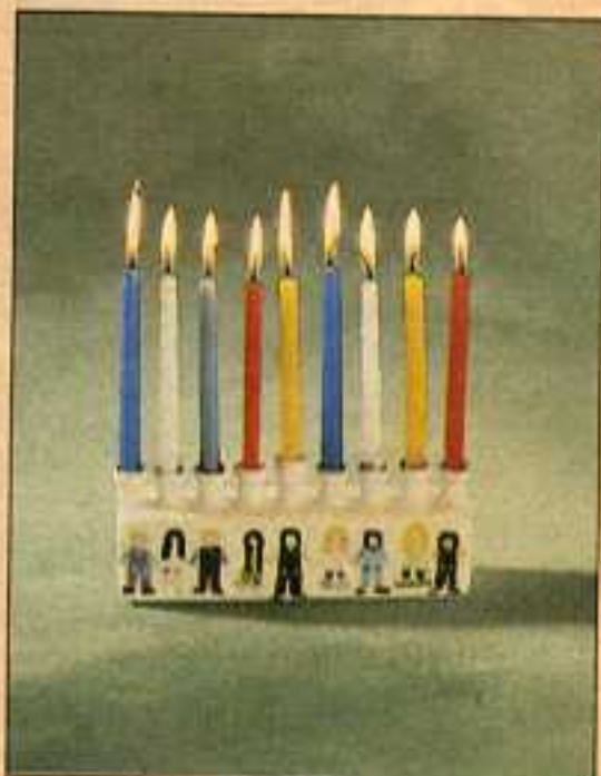
חנוכיית ילדים, קרמיקה ועיטורים ציורי יד, בעיצוב טוסרנע. מחירו: 140 שקלים